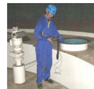
屋外タンクの内部点検中

しかし、8月に入ると台風が発生しました。東シナ海に発生した台風5号は、8月2日の時点で、四国愛媛を直撃する模様です。現地で作業している私達は、気が気ではありません。今回の工事工程では予定にないタンカーの受入が影響して、