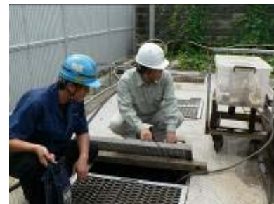
きれいに清掃された、油水分離槽。油はほとんど検知されませんでした。

また、交通量の少ない日曜日に、ボランティアで、工場周辺の道路清掃を、工場長自ら行ってお