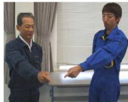
島田工業(株)門屋さんとはKYを行っています。