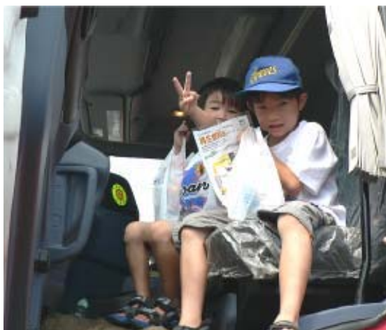
大型タンクローリーの試乗会も行われました。