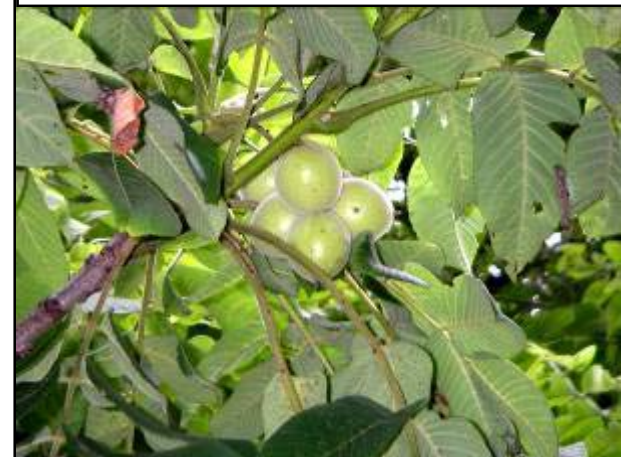
「オニゲルミ」5月から6月に開花し、その後直径3センチ程度の仮果とよばれる実をつけます。仮果の中に核果があり、その内側の仁を食用とします。(インターネットより 写真:長野)