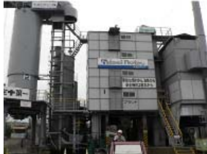
アスファルトプラント全景

大成ロテック株式会社 鳥取合材工場 様 〒680-0911 鳥取市千代水4-77 TEL 0857-28-5326 FAX 0857-28-3138