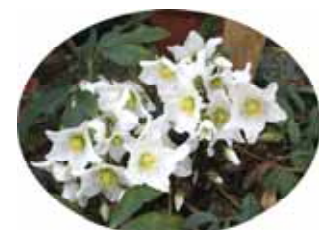
花見頃 クリスマスローズも