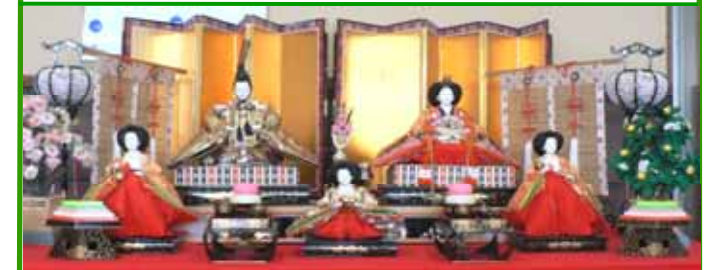
道の駅サンピコごうつ(江津市後地町)に展示されていました。(4月2日撮影)

東日本を襲った巨大地震と津波は、甚大な被害をもたらした。あまりに厳しい現実、言葉もない。西日本に住んでいる私たちは、平穩に普段通りの生活が出来ることが不思議なくらいだ。 この平穩な日々は、感謝しなければならぬ。 (長野)