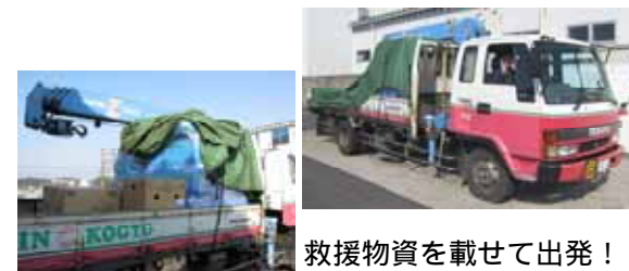
救援物資を載せて出発!