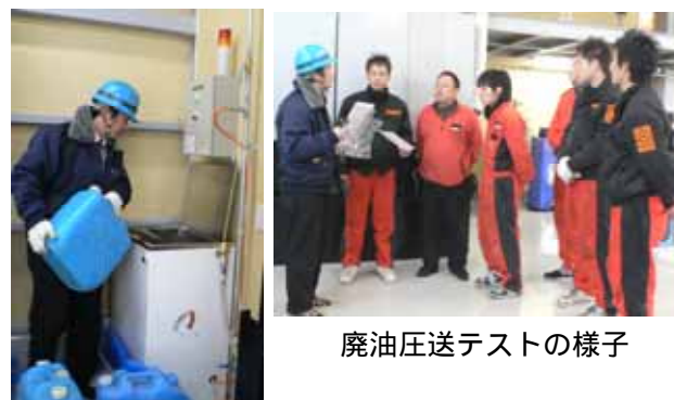
廃油圧送テストの様子

初期トラブルは必ず発生するので、今後改善を重ねていく。お互いに安全意識を高め、日常管理や定期的な設備の点検を行うことによって、安心してオイル交換等の業務ができるよう、バックアップしていきます。(福岡)