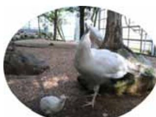
白クジャクの親子(写真上)とアナホリフクロウ(写真下)

3月27日、白クジャクの雛が生まれました。冠がちょこっとできてきて、とてもかわいいです。名前を呼ぶと近くに寄ってきます。