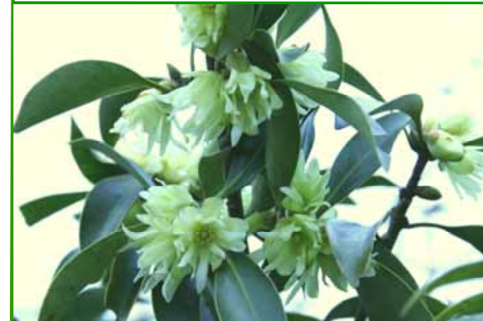
「シキミ」 墓前や仏前に供える木として知られ、ハナノキとも言います。熟した果実は中華料理に使う「八角」にそっくりですが、猛毒です。3~4月に開花します。

たのしい、おもしろい、嬉しいという思いが心の中に生じた時ほど、朗らかな生きがいを人生に感じられるということ。 人生は心であり、観念です。 何かがあれば、「ああ、たのしい、うれしい」と思うようにすればいいのです。(長野)