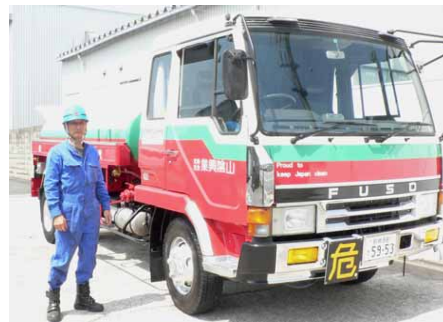
#102と石橋社員。(左写真) りりしい後ろ姿にうっとり。(下写真)