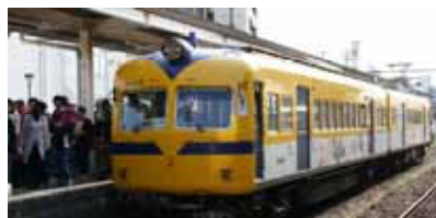
記念すべきバタデン

一畑グループ創立100年の記念イベントとして、4月7日8日の二日間、一畑電車の運賃が無料になり、乗車させて頂きました。幼少期や