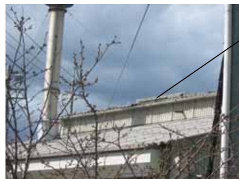
飛ばされたスレートの一部