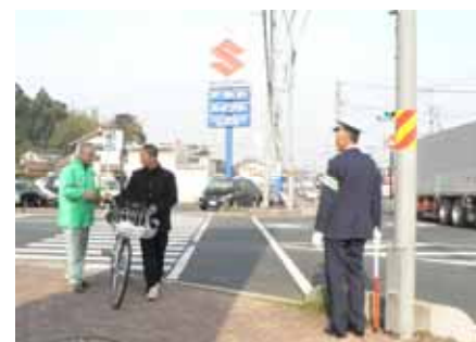
登校する生徒さん達は皆、安全な横断でした。

通行するみなさんは、元気な声で、「おはようございます」と挨拶してくれました。小学生は集団登校ですが、人数が多いと列が長くなり、横断歩道を渡りきらないうちに、信号が変わってしまいます。急いでわたりましょう。東出雲中学校の自転車通学の生徒さんは、きちんと縦列で通行していました。(長野)