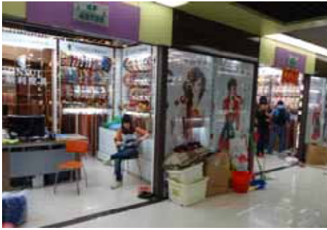
写真は義烏市場の様子