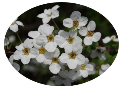
「ユキヤナギ」白い花を雪が積もったように咲かせることから、命名されたようです。