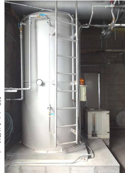
取替えられた給水タンク

「このたびの工事について、安全性・コスト・使い勝手など皆で勉強・検討しながら、約半分というムダのないタンク容量にサイズ変更することができた。現場の人と一緒に考えてのが良かった。