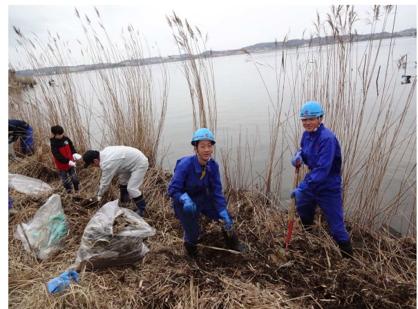
今年は天気に恵まれ、作業がはかどりました。

本清掃も地元の皆さんの協力で定着してきました。皆さんの環境意識も向上し、いつまでも美しい神西湖であることを願っています。(長野)