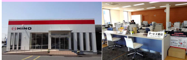
新事務所外観(写真左)と、とても明るくなった事務所内。

〒680-0942 鳥取県鳥取市湖山東4丁目15 TEL 0857-28-4821 FAX 0857-28-3659