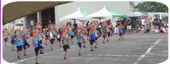
子供たちの踊りに、会場からは大声援が！