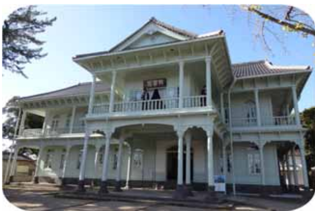
松江城山公園内に位置する、「興雲閣」

明治時代の貴重な建築物として、再建されたことは非常に喜ばしく、その歴史と文化財としての価値を未永く後世に伝えていかなければならないと感じます。(長野)