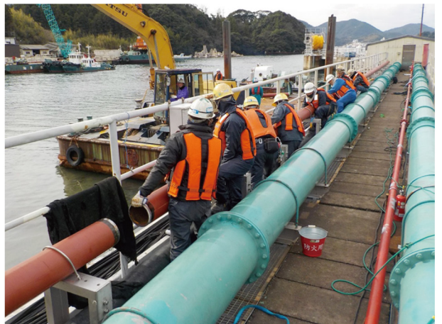
スパット台船を使用し棧橋上に燃料受入配管を新設