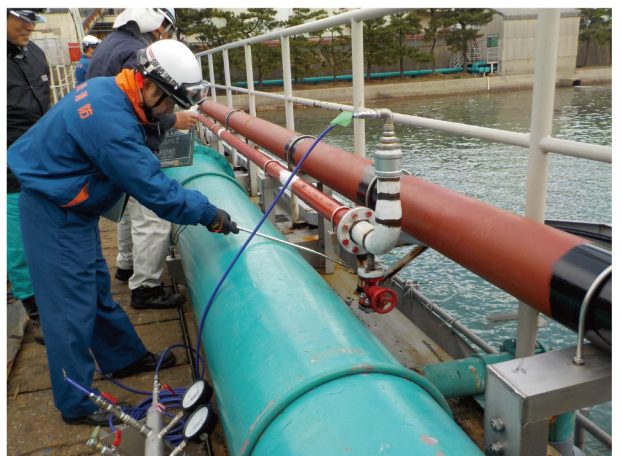
消防立ち合い検査