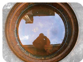
雨水が溜まった状態

例年のこの時期は、屋外にある地下タンクも雪で覆われていてマンホール内の確認が出来ない時期です。幸い今シーズンは雪が降らないため、マンホールの蓋を空けて雨水の浸入で水が溜まり配線等が水没していないか等を確認して見る良い機会ではないかと思えます。